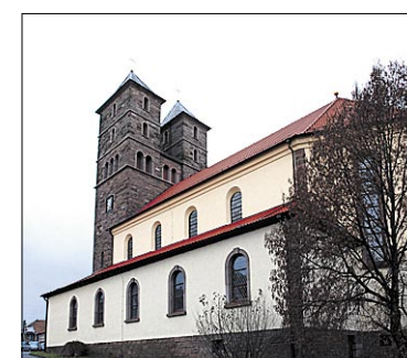
St.-Nikolaus-Pfarrkirche in Hohes Kreuz-Siemerode, aus der der Deutschlandfunk die Sonntagsmesse um 10.05 Uhr im Hörfunk überträgt.